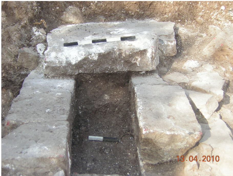
איור מספר 3: קבר 1.

בחפירת 2010 נמצא חלק מבית קברות מהתקופה הרומית (המאות הראשונה-הרביעית). הקברים מגוונים וכוללים קבורה על גבי הסלע, קברים חצובים ומקורים וקברי ארגז. לא ניכר כיוון אחיד או תכנון במיקום הקברים. ממצא זה מצביע ככל הנראה על יישוב שהיה במקום בתקופה זו. יש מקום לשער שמדובר ביישוב יהודי לאור אופי הממצא הקרמי, שכלל כלי כפר חנניה ולא כלל כלי יבוא, וכן לאור השוני מממצאי החפירה בתקופה הביזנטית (להלן).